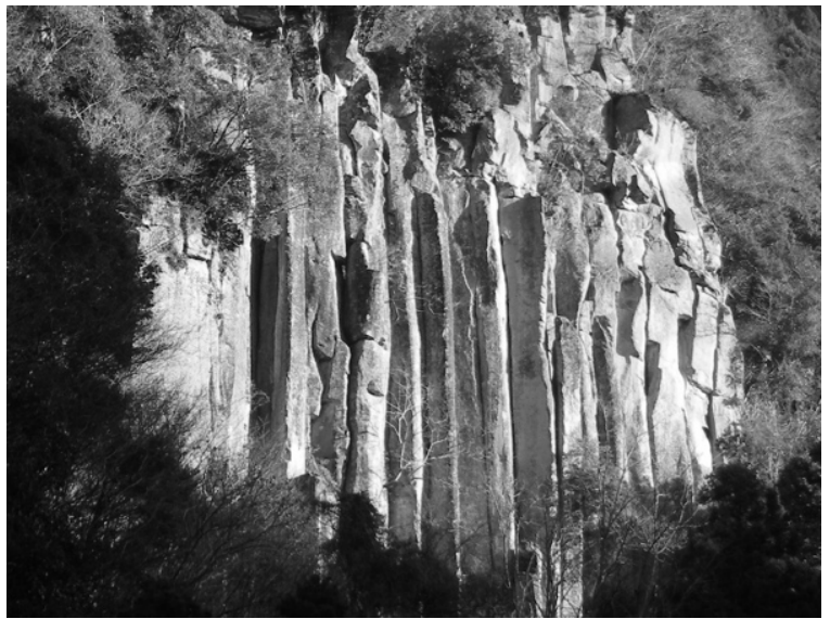
第一岩壁の上部壁を遠望

※これだけで事故を未然に防ぐことはできませんが、幾つかのリスクに配慮することで、行動全体がより注意深くなり、事故を減らす事ができると考えています。