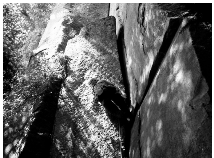
ちびゴジ サニーサイド